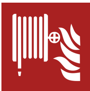
Kennzeichnung eines Löschschlauches durch das Brandschutzzeichen F002