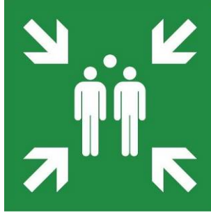
Kennzeichnung einer Sammelstelle durch das Rettungszeichen E007 (Muster)