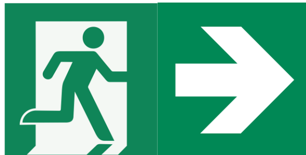
Kennzeichnung eines Rettungsweges/ Notausgangs bestehend aus Rettungszeichen E002 „Rettungsweg/ Notausgang“ und Zusatzzeichen (Richtungspfeil) (Muster)