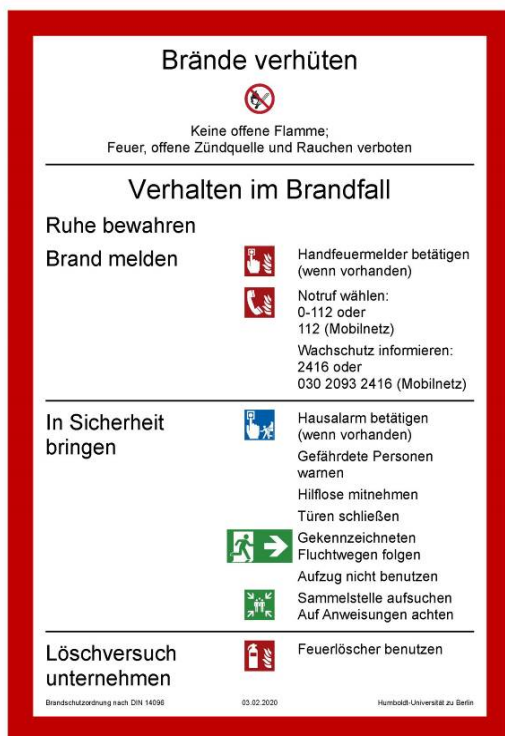
Aushang (Gebäude außer Adlershof)

Der Aushang der HU-Rahmenbrandschutzordnung erfolgt in Form der HU-Rahmenbrandschutzordnung – Teil A ( https://www.ta.hu-berlin.de/brandschutz ). Es erfolgt ein Aushang für die Gebäude mit Ausnahme der Gebäude auf dem Campus Adlershof (links) sowie ein Aushang für die Gebäude auf dem Campus Adlershof (rechts):