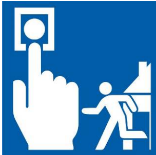
Kennzeichnung einer Meldeeinrichtung für den Hausalarm (Muster)

Sind keine der oben gezeigten Meldeeinrichtungen vorhanden, so ist der Notruf telefonisch zu kontaktieren (siehe HU-Rahmenbrandschutzordnung – Teil A). Zusätzlich ist der Hausalarm auszulösen, sofern vorhanden. Dieser dient der internen Alarmierung von Personen im Objekt.