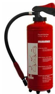
Tragbarer Feuerlöscher (Muster)