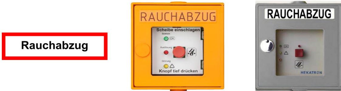
Kennzeichnung eines Tasters für den Rauchabzug (Muster)

Rauch- und Wärmeabzugseinrichtungen ermöglichen es, dass im Brandfall Rauchgase abziehen können. Sie werden entweder automatisch gesteuert oder sind durch Beschäftigte und Studierende sowie die Feuerwehr zu bedienen. Eine Zweckentfremdung (z. B. für Lüftungszwecke) ist unzulässig.