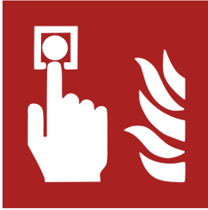
Kennzeichnung eines Handfeuermelders (auch nichtautomatischer Brandmelder) durch das Brandschutzzeichen F005

Meldeeinrichtungen dienen zur Alarmierung der Feuerwehr bei Bränden und sonstigen Notfällen.