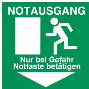
Kennzeichnung von Not-Auf-Tasten (Muster)