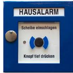
Meldeeinrichtung für den Hausalarm (Muster)