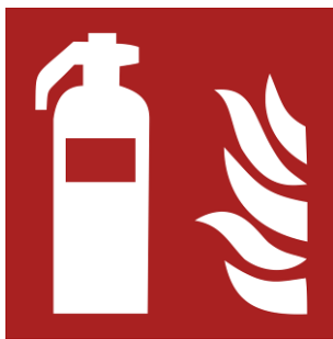
Kennzeichnung eines tragbaren Feuerlöschers durch das Brandschutzzeichen F001

Löscheinrichtungen (auch Feuerlöscheinrichtungen) wie tragbare Feuerlöscher oder Löschschläuche (auch Wandhydranten) dienen der Bekämpfung von Entstehungsbränden. Die Bekämpfung von Entstehungsbränden darf nur ohne Eigengefährdung durchgeführt werden. Löscheinrichtungen sind an unterschiedlichen Stellen vorhanden deutlich gekennzeichnet.