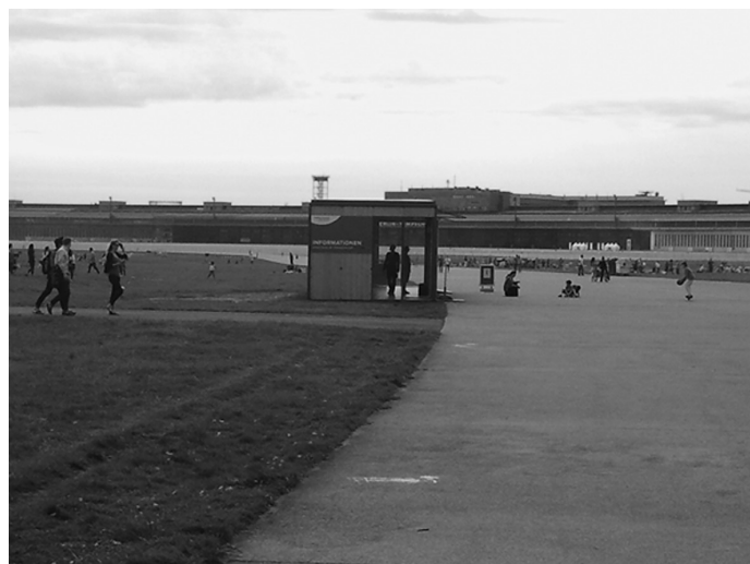
Typ 1 – informierend; Bsp: Infopavillon auf dem Tempelhofer Feld Berlin.