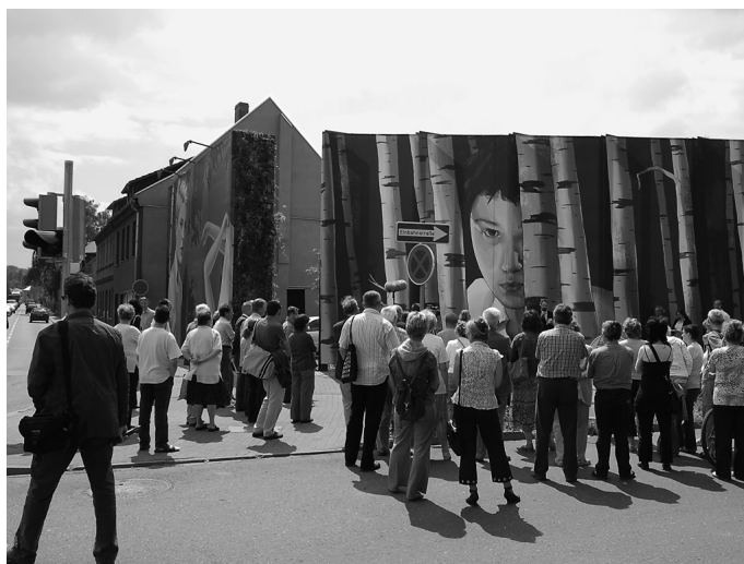
Typ 2 – auffordernd; Bsp: IBA Stadtumbau 2010, Aschersleben.