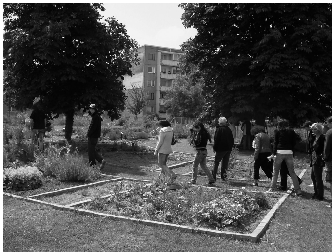
Typ 4 – gestaltend; Bsp: 400qm Dessau. (Quelle: Stadtverwaltung Dessau-Roßlau, Stiftung Bauhaus Dessau (o.J.): 2)