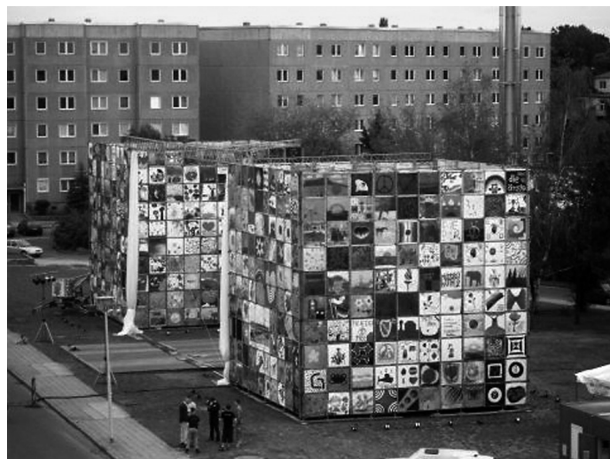
Typ 3 – mitwirkend; Bsp: Forster Tuch.